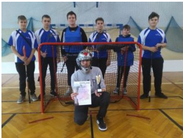
W-ce Mistrzowie Powiatu