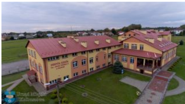
SP im. Jana Pawła II w Kupnie