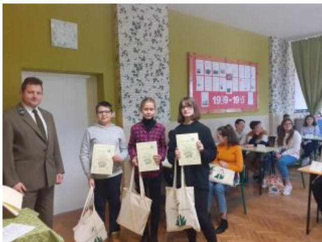
X Gminny Konkurs Matematyczno-Przyrodniczy