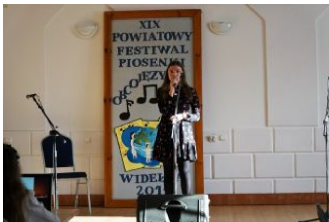
Młodzi wokaliści w Widelce